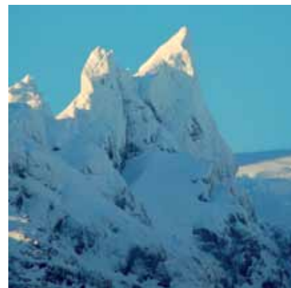
Aguja indeterminada al sur del Seno Benavente