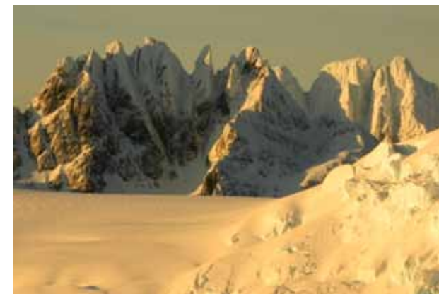
Cerro Cinco amigos izquierda, solo una aguja menor a sido escalada y Cerro Cota 1429 al fondo a la derecha.