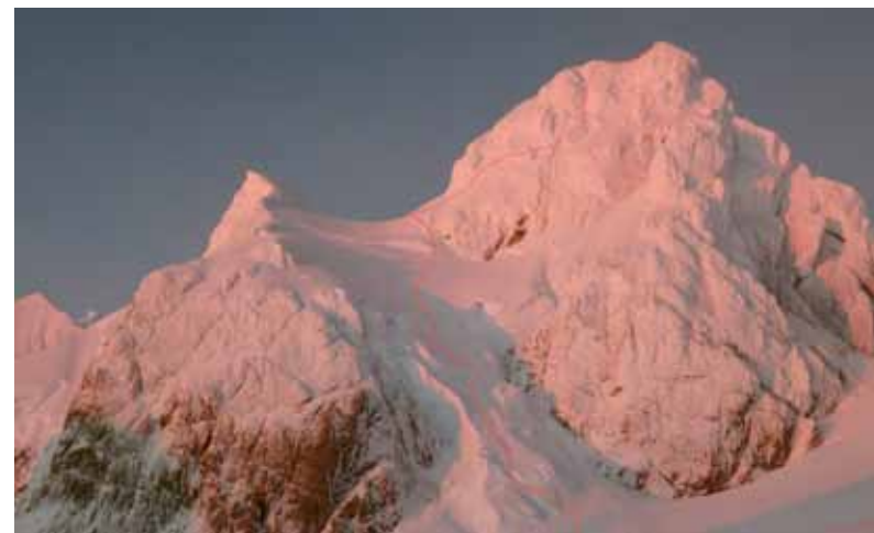
▶ Ruta primera ascensión del Cerro Alas de ángel de 1.767 m (tercera cumbre más alta de la Cordillera de Sarmiento), Pared NE, 550m, D+